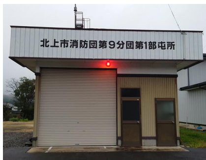
消防団員不足対策の意味でもエアコン設置が望まれる屯所

北工業団地へ向かう、いわゆる「産業道路」の上野町以北2.7kmを3車線化する為の道路予備設計を実施する予定だったが、環状交差点の完成が遅れた事により、繰越しとなった。