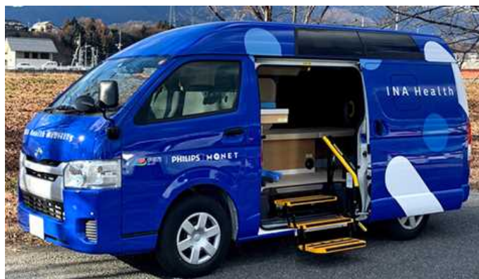
長野県伊那市の遠隔診療専用車両