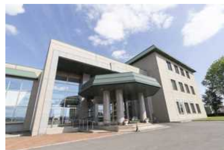
北海道名寄市(人口3万人弱)の名寄市立大学1号館 福祉・看護・教育関係の学部があり、北上市からも毎年のように進学者が居る

校舎をつなぐ部分に設置してあるエクスパンションに、令和3年2月の地震でひびが入ったもの。地震によるひずみを吸収するための装置なので、その役割を果たした事による補修。