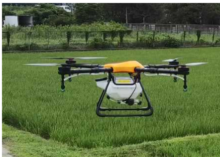
ドローンによる農薬散布 (イメージ写真)