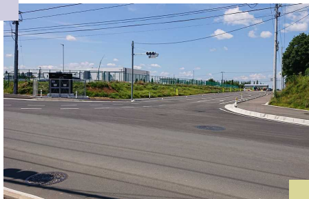
市道川原町南田線の一部廃止 に伴い新たに開通した東部道路 (岩手3Mの北側)