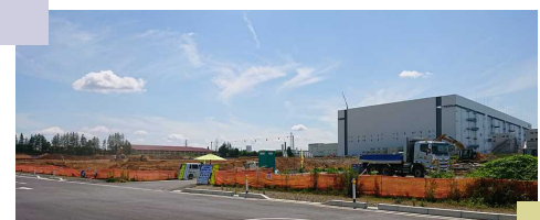
造成中のK2建設予定地

答弁 K1建設のピーク時は、約3,000人/日の作業員数だった。その内約500人が30分圏内に滞在し、約4割がアパート、約4割が旧雇用促進住宅、約2割がホテルなどの宿泊施設を利用した。移動手段としては、社用車や宿泊施設の送迎などがほとんどであった。市では、K2など複数棟の建設を想定して周辺道路整備などを進めており、宿泊施設も東口の整備事業により新たなホテル(約190室)も建設中である。