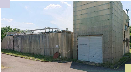
解体予定の流通センターの 旧 汚水処理施設 (スパ・オセンの3区画隔てた西側)