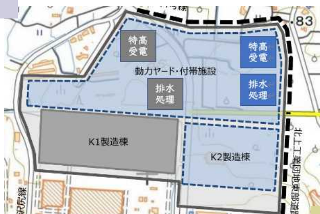
キオクシア岩手K2までの拡張予定図 (K2はK1より高層化の予定)