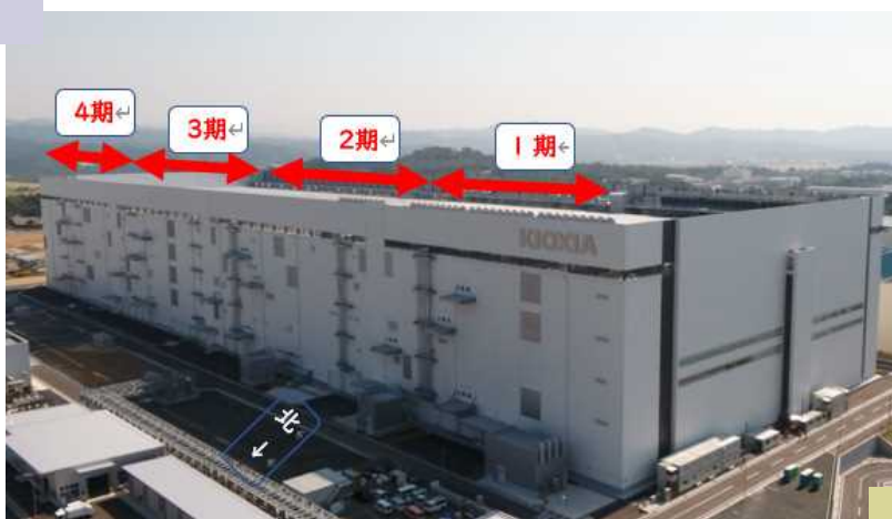
キオクシア岩手第1製造棟(K1)

いずれにせよ、日本の半導体産業のうち、高度集積を伴う製品では、30年間持続しているメーカーは稀有です。20年30年先を考えた時に、今回の市道の廃止や、前号で指摘した環状交差点化は、将来に不安が残ります。