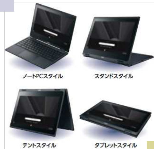
小中学生に配布されたNEC製ChromeBook

↑ ChromebookはGoogleのChromeOSを使用しているコンピューター。シンプルで起動が早く価格も安い。北上市で導入した端末は、LTEタイプなので携帯電波を利用して直接ネットにアクセスできる。