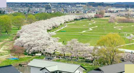
100周年を迎え延命措置が必要な展勝地桜並木