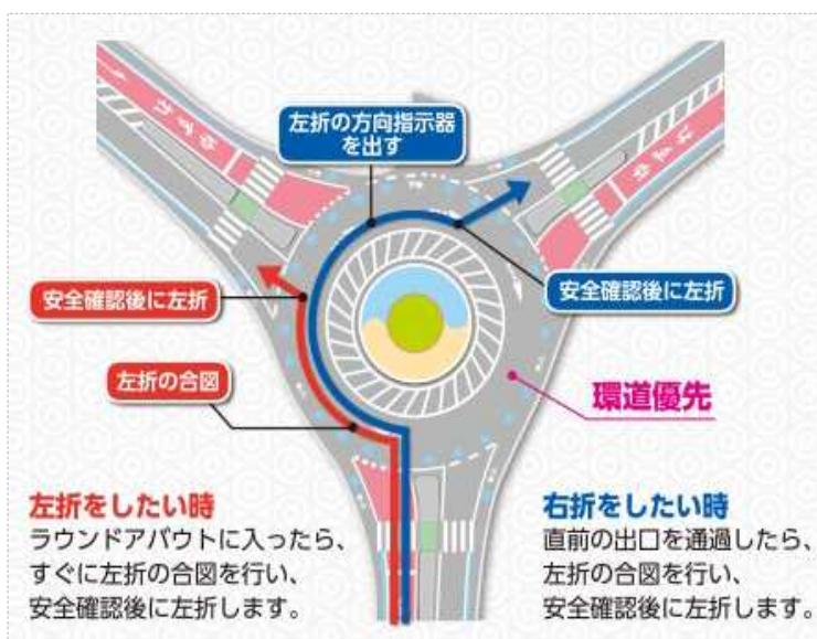
三差路での環状交差点事例(新潟市)