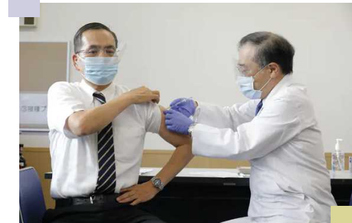
新型コロナワクチン接種 (市外の医療関係者への接種の様子)

答弁 新設する東部地区の小中学校や、飯豊中の長寿命化改修から対応する。スロープやエレベータ設置など、基準に合った整備を行っていく。