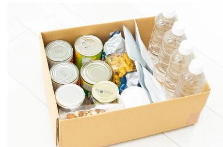
各家庭でも災害時に備えておきたい備蓄品（イメージ写真）

職員側と利用者側にそれぞれ画面があって、支払いをQRコードやクレジットカード等で支払えるような仕組みの機械を3台導入。