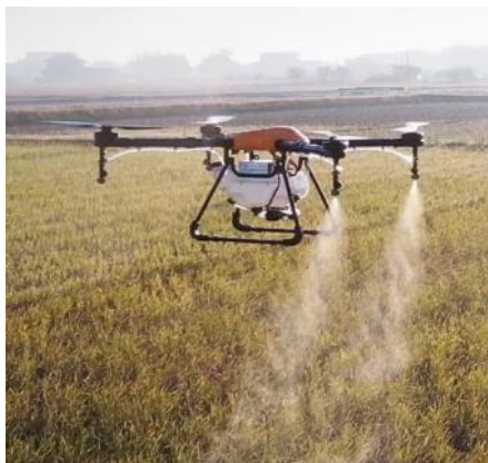
農薬散布などに活用できる 農業用ドローン

駅東口から北工業団地へ向かう、いわゆる“産業道路”の上野町以北を三車線化する事業で、実施設計と一部の工事を着工して早期完成を目指すもの。国の補助の付き方に影響される為、完成時期は定められていない。