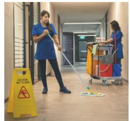
2人に月額約95万円も支払っている清掃委託（イメージ写真）